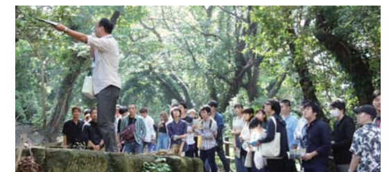
横須賀市と連携して実施された、市内の遊歩道を活性化するためのワークショップには多くの学生が参加した。

法律知識を活かしながら地域社会における災害・犯罪等のリスクに的確に対応できる警察官・消防士等の公務員、防災関連企業やNPO防災リーダー等の人材の養成を目指します。