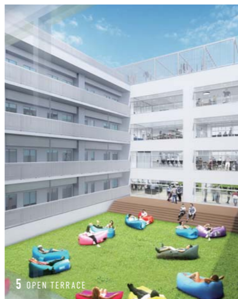
5 OPEN TERRACE

1 COMMUNICATION ZONE 【コミュニケーションスペース】：フロアごとに、共用ラウンジ、リラックスゾーン（テレビルーム、シアタールーム）、コンセントレーションゾーン（スタディラウンジ、デスクカウンター）を完備。コミュニケーションスペースとして自由に活用できます。 2 RECEPTION 【レセプション】：管理人が常駐。不審者の侵入防止をはじめ、セキュリティを提供。 3 PRIVATE SPACE 【プライベート空間】：1人、2人、4人用のユニットを用意。4人ユニットでもプライベート空間はしっかり確保。シャワールーム、トイレは2人で1か所を利用。 4 DINING ZONE 【ダイニング】：各フロアにキッチン付きの共用ダイニングスペースと調理器具を用意。自炊はもちろん、仲間とパーティーを楽しむこともできます。 5 OPEN TERRACE 【オープンテラス】：寮生だけが利用できる開放的なアウトドア空間。降り注ぐ陽光の下、仲間とともに会話を楽しんだり、ゆったりとくつろぐことができます。