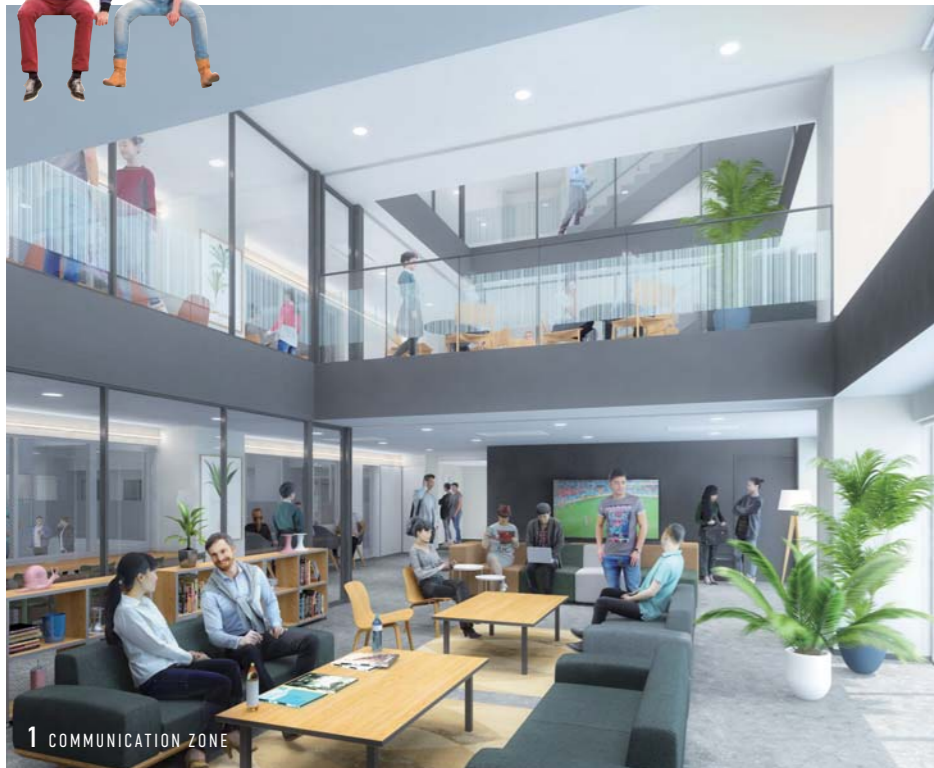
1 COMMUNICATION ZONE