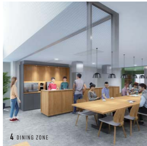
4 DINING ZONE